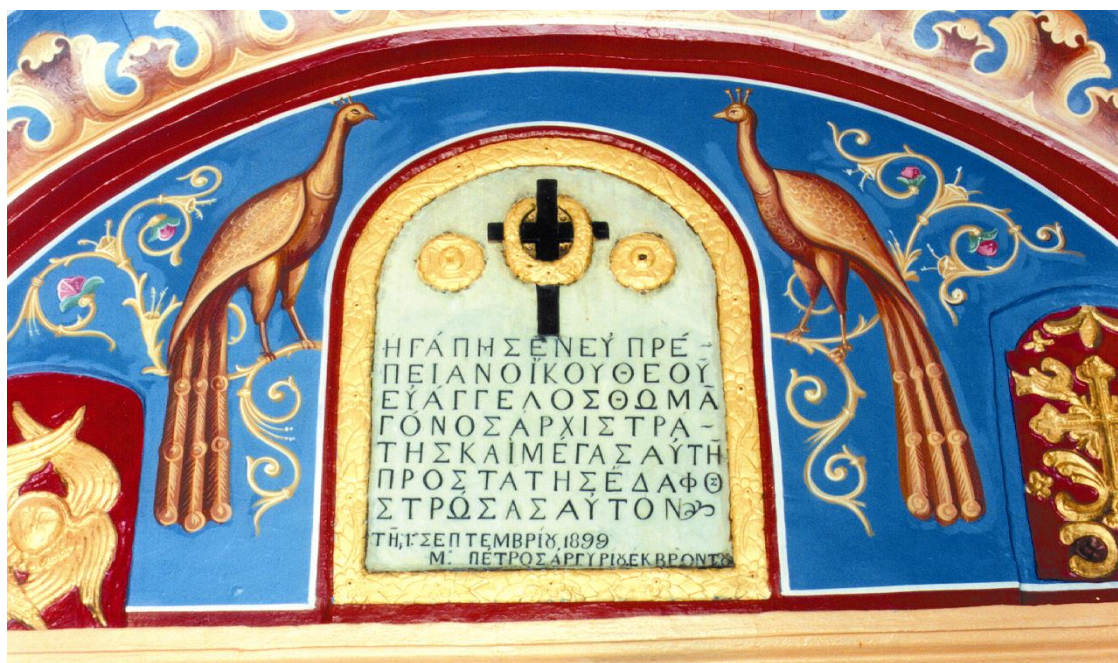
Επιγραφή του 1899 του ναού Αγίου Αθανασίου αφιερωμένη στον μεγάλο Αλιστρατινό ενεργήτη Ενάγγελο Θωμά