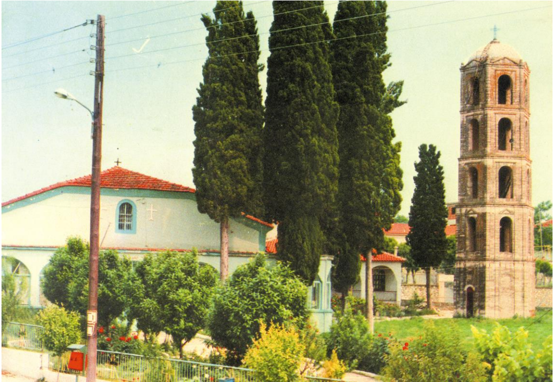
Γενική άποψη του Ιερού Ναού Αγίου Αθανασίου Αλιστράτης, όπως ήταν παλαιότερα.