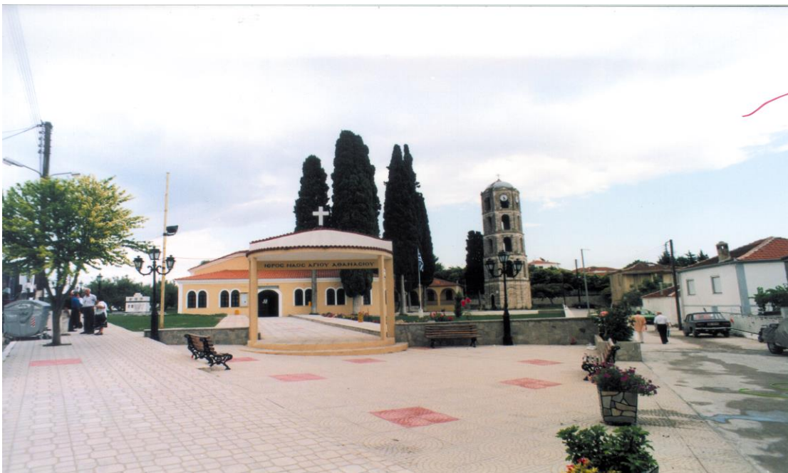
Η πρόσοψη του Ιερού Ναού Αγίου Αθανασίου όπως είναι σήμερα