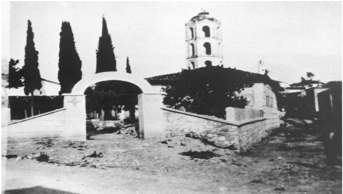
Η είσοδος του Ιερού Ναού Αγίου Αθανασίου με το καμπαναριό, όπως ήταν παλαιότερα. Δεξιά διακρίνονται τα δωμάτια που υπήρχαν τότε.