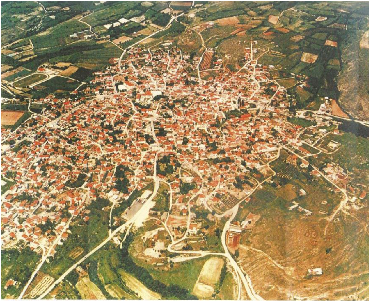
Πανοραμική άποψη της Αλισσράτης.