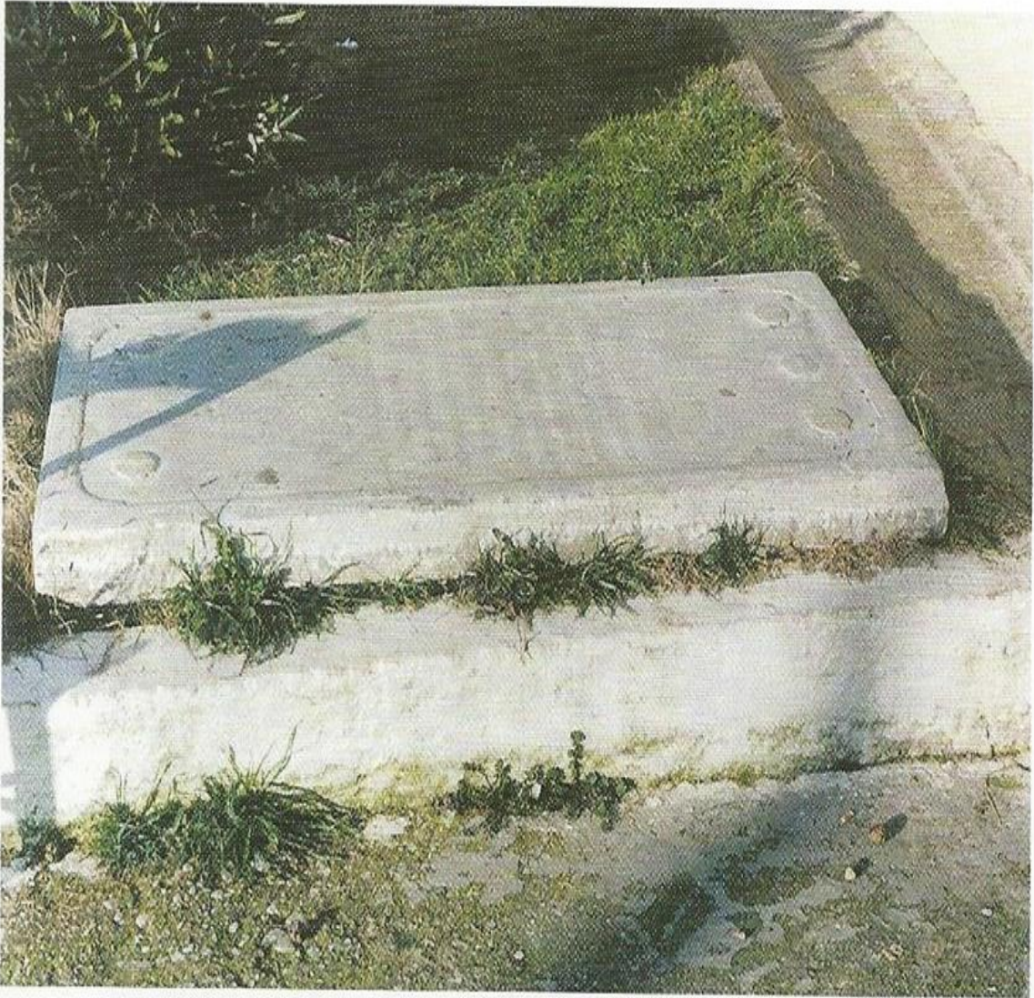
Η πλάκα του τάφου των Μητροπολιτών που βρισκόταν στο Νάρθηκα του Ι. Ναού Αγίου Αθανασίου. (Φωτ.: Γ.Ι. Γεωργιάδης).