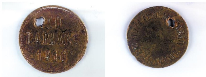
Το νόμισμα που είχε εκδώσει ο Ιερός Ναός Αγίου Αθανασίου το 1910. Αριστερά η μία όψη με ένδειξη: "10 ΠΑΡΑΔΕΣ 1910". Δεξιά η άλλη όψη, αναγράφεται κυκλικά: "ΕΚΚΛΗΣΙΑ ΑΓΙΟΥ ΑΘΑΝΑΣΙΟΥ ΑΛΙΣΤΡΑΤΗ".