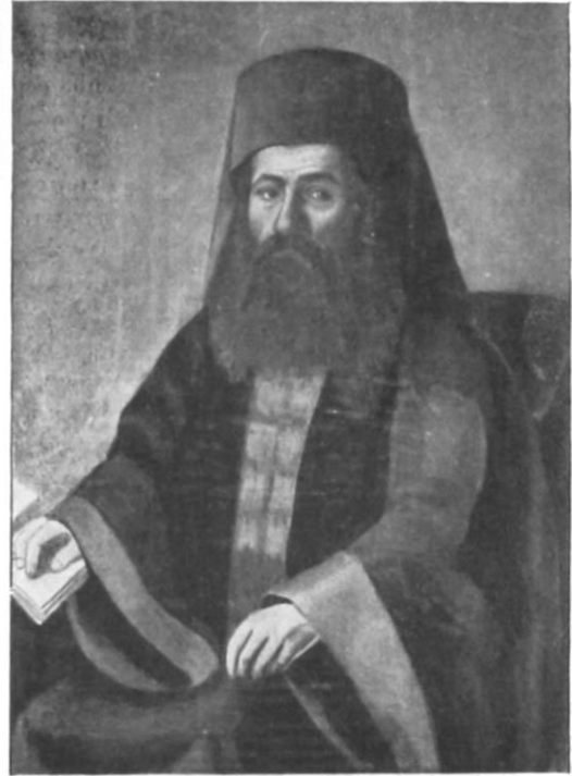
Ὁ Πατριάρχης Κων/πόλεως Χρυσανθος ὁ ἀπὸ Σερρῶν (1824)

Επίσης δεν μπορεί να μη γίνει αναφορά στις τουλάχιστον δύο κατηγήσεις νέων μελών της Φιλικής Εταιρίας στις Σέρρες από τον Ιωάννη Φαρμάκη το έτος 1818· επρόκειτο για τον έμπορο Αστέριο Γ. Σκανδάλη με καταγωγή από τα Άγραφα και για τον μητροπολίτη Σερρών Χρυσανθο, ο οποίος αργότερα έγινε Οικουμενικός Πατριάρχης Κωνσταντινουπόλεως (από τις 9 Ιουλίου 1824 μέχρι τις 26 Σεπτεμβρίου 1826, όταν με βασιλική διαταγή εξέπεσε του αξιώματός του και εξορίστηκε αρχικά στην Καισάρεια και εν συνεχεία στην Προύσα).