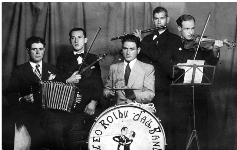
Σερριώτικη μπάντα Ελαφράς μουσικής κατά τα πρώτα χρόνια της μεταπολεμικής περιόδου.