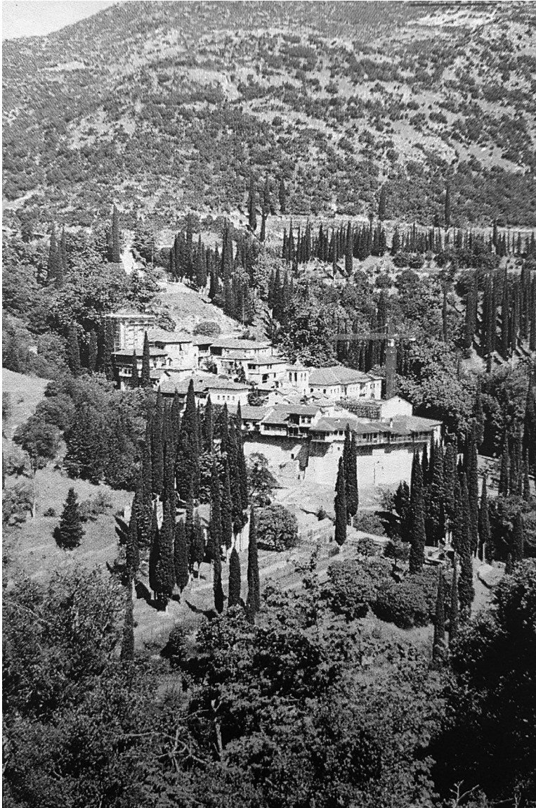
Άποψη της Ιεράς Μονής Τιμίου Προδρόμου Σερρών.