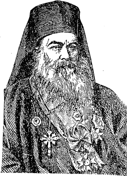
ΙΑΚΩΒΟΣ ΚΑΣΑΝΔΡΕΙΑΣ (ξύλογραφία τοῦ 1863)

Μετὰ νοημοσύνης καὶ διοικητικῆς συνέσεως εἰργάσθη καὶ Ἰάκωβος ὁ μητροπολίτης Κασανδρείας, (εἶτα Σερρών, καὶ τέλος πατριάρχ-