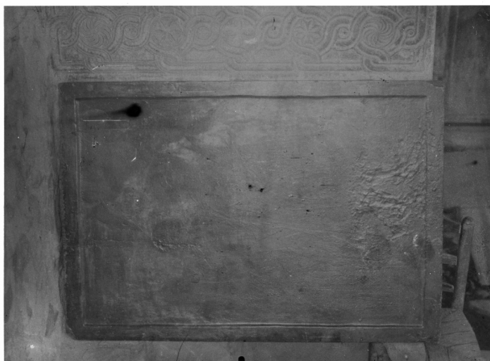
ΣΕΡΡΑΙ. Μητροπολιτικός ναός Αγίων Θεοδώρων. Εικόνα αγίου Θεοδώρου.

Για να μελετηθεί η εικόνα, η φωτογραφία επεξεργάστηκε ψηφιακά σε υπολογιστή. Πρώτα, από τον γράφοντα, η φωτογραφία γυρίστηκε