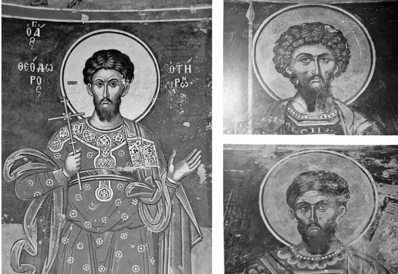
Εικ. 3. Αριστερά ο άγιος Θεόδωρος ο Τήρωνας, Καθολικό Ι.Μ. Διονυσίου. Δεξιά οι άγιοι Θεόδωροι Στρατηλάτης και Τήρωνας, κελί Μολυβοκκλησιάς (Σ. Θ. Παντζαρίδης).