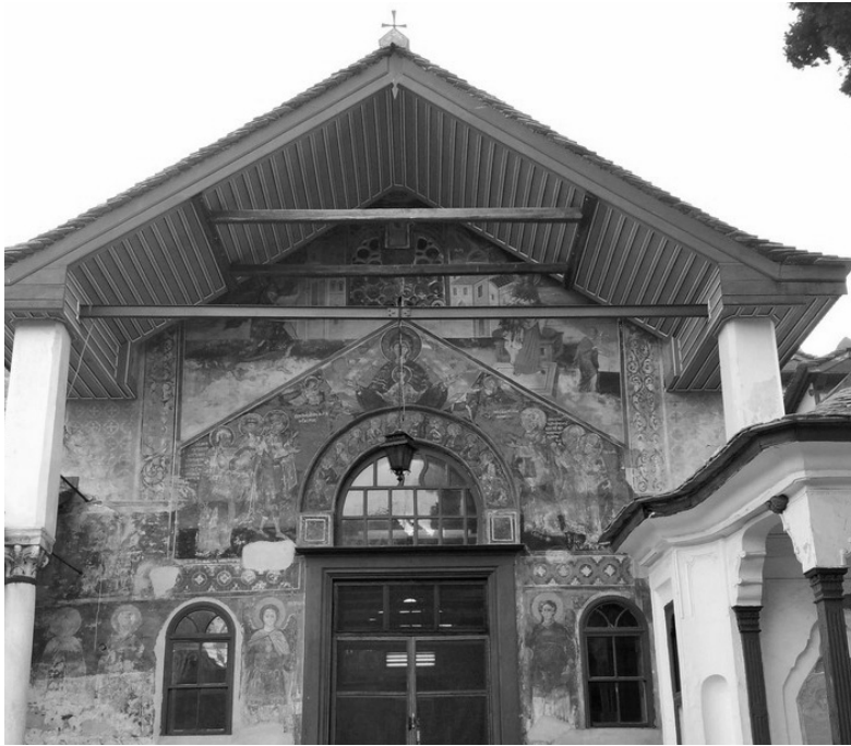
Εικ. 1. Η πρόσοψη της Τράπεζας της Ι. Μ. Μεγίστης Λαύρας με την κτητορική παράσταση.

Ο Κ. Βαφειάδης αναφέρει ότι υπάρχει καλλιτεχνική συγγένεια ανάμεσα στον/στους ζωγράφους του Καθολικού της Ι. Μ. Κουτλουμουσίου, του ζωγράφου Α του Καθολικού της Ι. Μ. Διονυσίου του Αγίου Όρους και των δύο ζωγράφων του κελιού της Μολυβοκκλησιάς του Αγίου