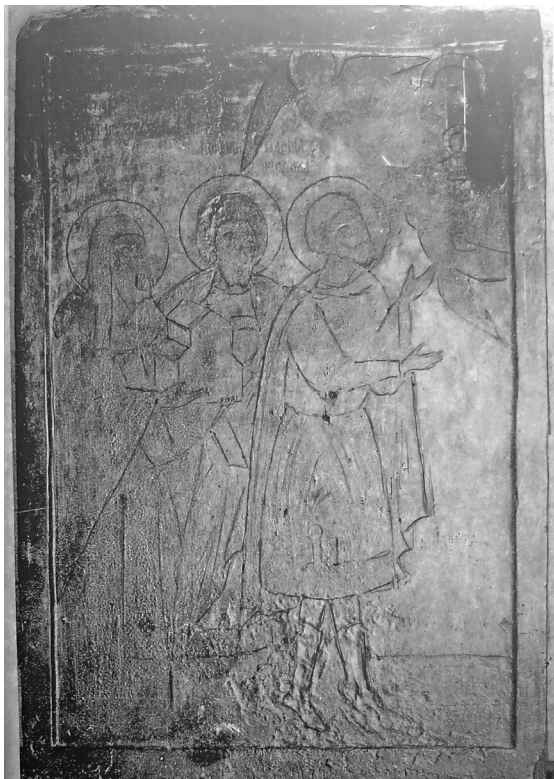
Εικ. 7. Η εικόνα της φωτογραφίας ΧΑΕ 3384 γραφιστικά τροποποιημένη με τονισμένες τις λεπτομέρειες των μορφών.

Ήταν μια σκαφωτή εικόνα με αυτόξυλο πλαίσιο, που αποτελούνταν από δύο τουλάχιστον ενωμένες ξύλινες σανίδες. Ο κάμπος της εικόνας ήταν πιθανότατα χρυσός. Ο Π. Παπαγεωργίου αναφέρει ότι το φωτοστέφανο του Γενναδίου ήταν αργυρό. Στη φωτογραφία όμως δεν φαί-