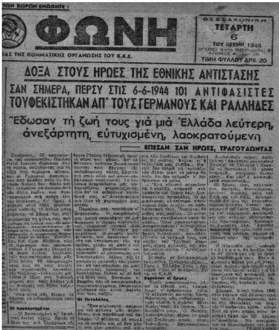
Εφημερίδα «Λαϊκή Φωνή» όργανο του γραφείου περιοχής Μακεδονίας της κοιματικής Οργάνωσης του ΚΚΕ (φ. 6-6-1945)

Κυριακή 30 Ιουλίου του 1944 ο Νομάρχης αποφασίζει να εκκλησιαστεί στην εκκλησία του Αγίου Γεωργίου. Διαβάζουμε στο βιβλίο μου "Όταν ο χρόνος αφηγείται" στη σελίδα 56: "Ο ΕΛΑΣ πληροφορείται την επίσκεψη του Νομάρχη στη Νιγρίτα και ετοιμάζει σχέδιο για την εκτέλεση του. Τρία παλληκάρια επιλέγονται για να τολμήσουν «το απονενομημένο αυτό διάβημα». Γίνεται κλήρωση με τρία σπιροτόξυλα (αφή-