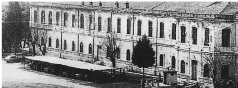
Το στρατόπεδο φυλακισμένων “Παύλος Μελάς” στη Θεσσαλονίκη.

ρώθηκε το 1905. Το 1912 μετά την παράδοση της πόλης από τον Χασάν Ταξίν πασά στον πολιτικό σύμβουλο του Στρατηγείου των Ελληνικών Δυνάμεων Βίκτωρα Δουσιμάνη (26 Οκτωβρίου 1912) το στρατόπεδο πήρε το όνομα του Μακεδονομάχου Παύλου Μελά. Το στρατόπεδο αργότερα επεκτάθηκε και κατασκευάστηκε δίπλα πεδίο βολής πυροβολικού. Την περίοδο της γερμανικής κατοχής υπήρξε η σκληρότερη φυλακή αγωνιστών και ο προθάλαμος εκτελέσεων στην «τούμπα», τον Γαλλικό ποταμό και στο 6ο χιλιόμετρο της οδού Λαγκαδά. Στον εφιαλτικό αυτό